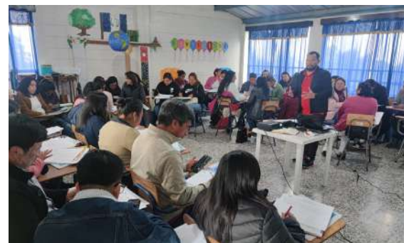
Oficinas para a capacitação de professores.