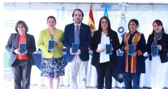
Entrega de kits tecnológicos para reduzir a lacuna digital na educação.